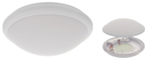
DABA LED SMD DL-170