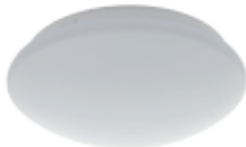
DABA LED ECO DL-100